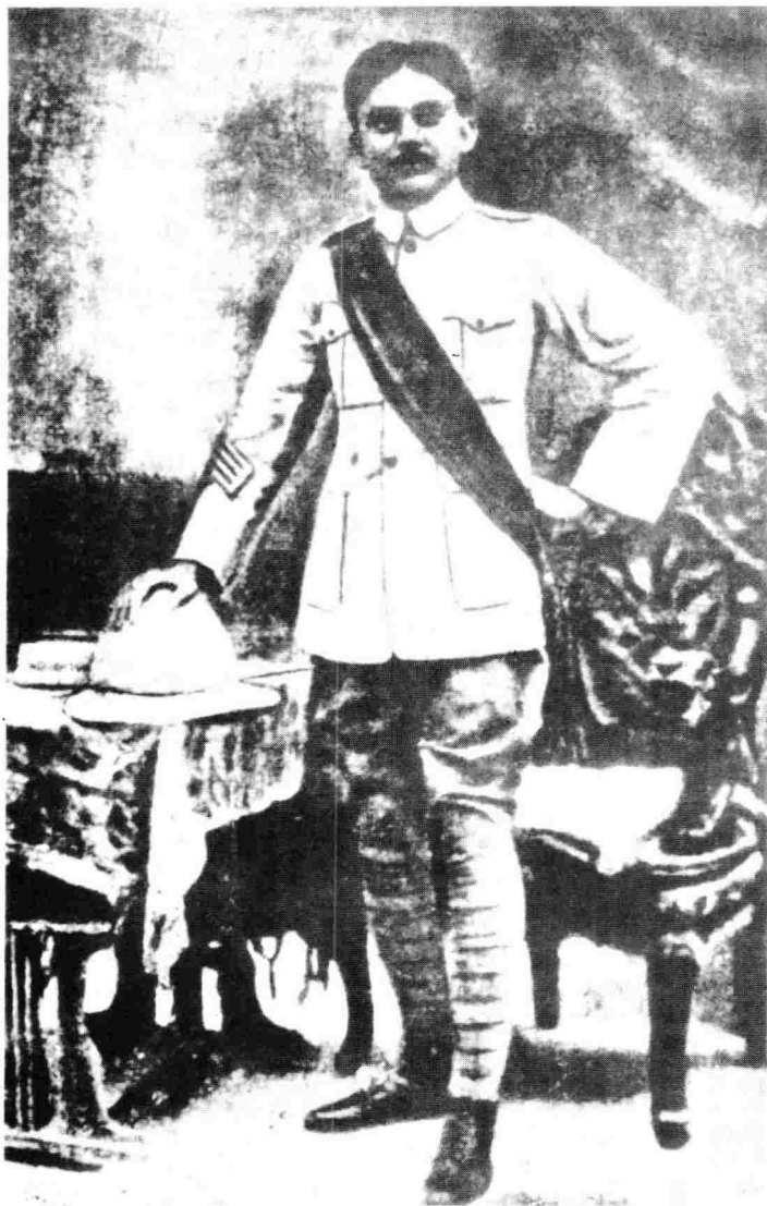
হাবিলদার-বেশে নজরুল ইসলাম : ২১ বছর বয়সে

‘নজরুল অ্যালবাম’ (অক্টোবর ১৯৯৪), নজরুল ইসটিটিউট, ঢাকা থেকে সংগৃহীত