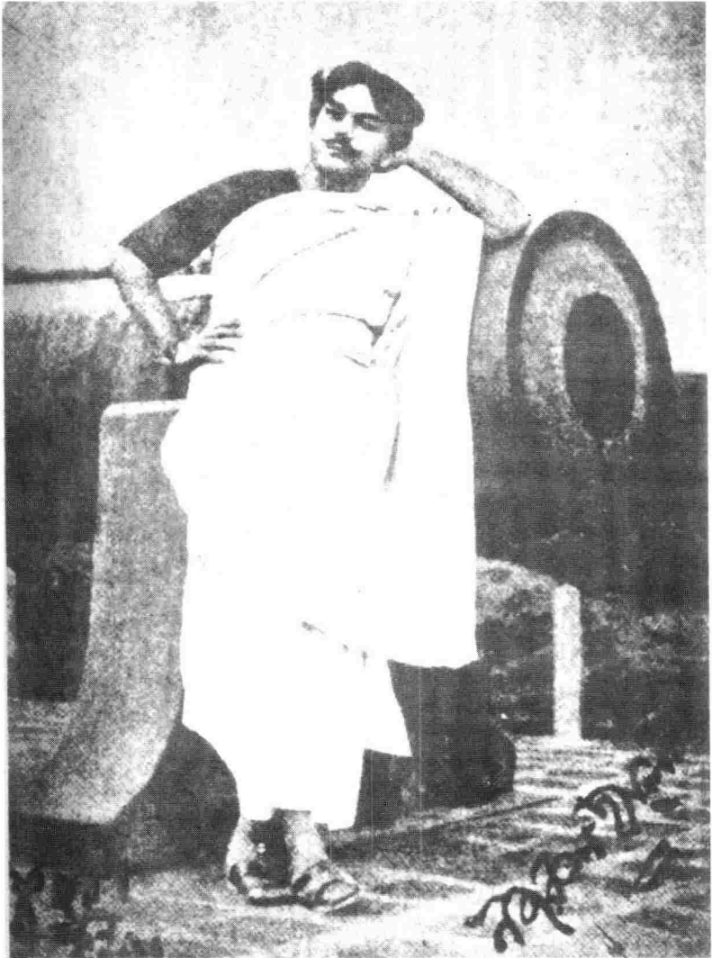
বাঁকুড়ার বিষ্ণুপুরে দলমাদল কামানের পাশে দাঁড়ানো নজরুল ইসলাম : ২৫ বছর বয়সে

‘নজরুল অ্যালবাম’ (অক্টোবর ১৯৯৪), নজরুল ইন্সটিটিউট, ঢাকা থেকে সংগৃহীত