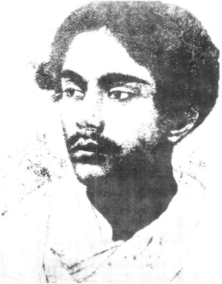
নজরুল ইসলাম : ২৪ বছর বয়সে

‘নজরুল অ্যালবাম’ (অক্টোবর ১৯৯৪), নজরুল ইন্সটিটিউট, ঢাকা থেকে সংগৃহীত