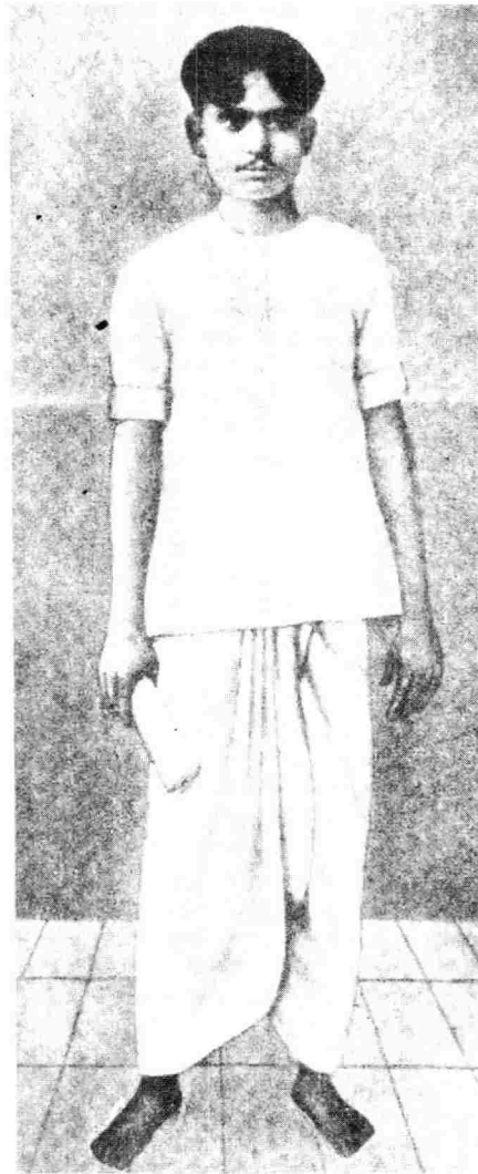
কিশোর বয়সে নজরুল ইসলাম