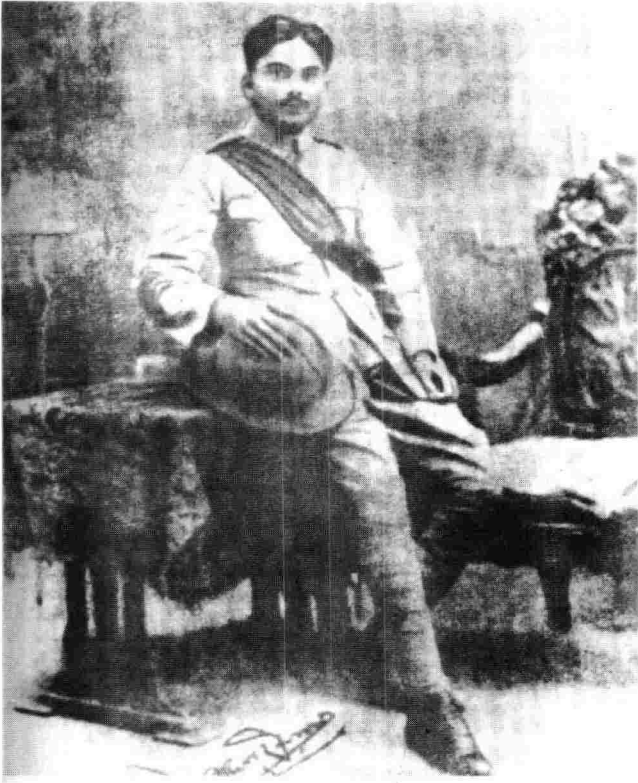
যুদ্ধ- ফেরত নজরুল ইসলাম

‘নজরুল অ্যালবাম’ (অক্টোবর ১৯৯৪), নজরুল ইন্সটিটিউট, ঢাকা থেকে সংগৃহীত